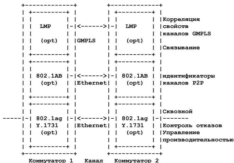
Рисунок 2. Опции управления логическим каналом.

В контексте GMPLS был определён протокол управления каналом (LMP) [RFC4204] для поддержки управления каналами и автоматического детектирования на уровне управления GMPLS. LMP также поддерживает автоматизированное создание безадресных интерфейсов для уровня управления. Если LMP не используется, возникают дополнительные конфигурационные требования к идентификаторам каналов GMPLS. Для крупных реализаций предпочтительно использование LMP. Протокол LMP также имеет опции контроля отказов, прежде всего для использования с прозрачными и «тёмными» (opaque) сетевыми технологиями. С новыми возможностями IEEE CFM [802.1ag] и ITU-T [Y.1731] такая функция может остаться невостребованной. Задачей архитектуры GMPLS Ethernet является обеспечение возможности выбора наилучшего набора средств в соответствии с потребностями пользователей. При использовании уровня управления GMPLS следует применять всю функциональность Ethernet CFM.